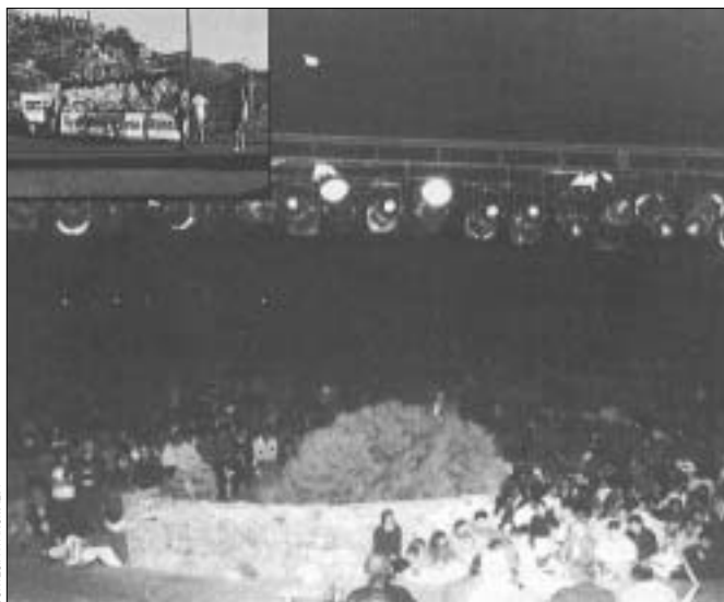
Instantánea de la alerta ovni de Las Cañadas del Teide el 24 de junio de 1989.

Así, como lo han leído, sin quitar ni poner ni una coma ni una tilde. Estos disparatados rumores, cul-