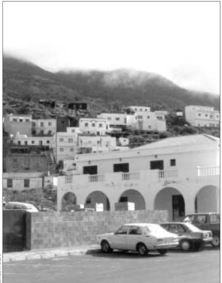
Imagen de la calle de Frontera (El Hierro) donde se celebró la verbena el 12 de agosto de 1995. Al fondo, entre la bruma, el pico de Malpaso, sobre el que aparentaba estar el “ovni” aunque en realidad el globo con las luces que motivó la confusión se hallaba mucho más bajo.

El análisis de las imágenes videográficas obtenidas por un cámara de una televisión local tinerfeña desplazada a la isla no mostró elemento alguno de extrañeza; sus características encajan con las que serían de esperar en el caso de que se hubiese tratado de un sencillo dispositivo eléctrico luminoso elevado por un globo.