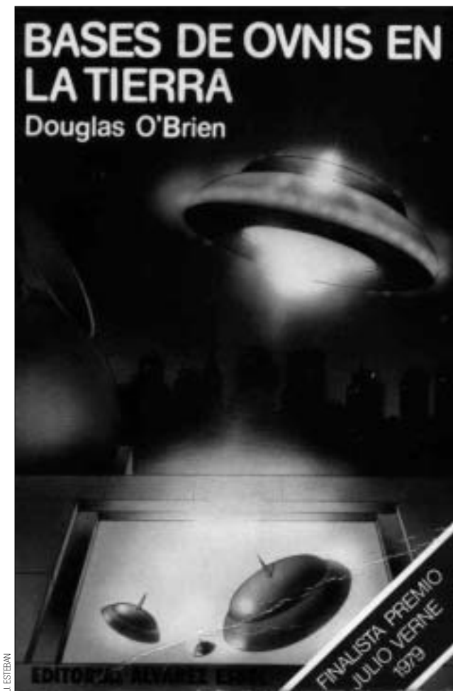
Portada de la novela Bases de ovnis en la Tierra.

blicación de artículos en los que se me reclamaba que confesase la verdad”. Estamos ante una de las mayores tomaduras de pelo de la historia al irracionalismo sensacionalista: se extendió en el tiempo durante más de quince años y casi todos los líderes de lo ufológico-paranormal en España picaron el anzuelo. Tanto lo picaron que alguno lo hizo suyo y lo regurgitó, plagiando las invenciones de Esteban.