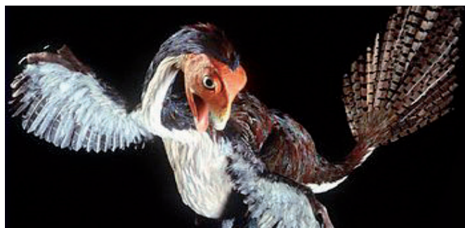
Caudipteryx zoui en el estudio del origen de las aves en Homo Webensis . (Ernesto Carmena)

Lo único que podría reprochar a esta página, no es un reproche propiamente dicho sino un lamento: me gustaría que se actualizara más a menudo para poder disfrutar de las contribuciones del autor y de sus colaboradores. Pero, con su riqueza en contenido, el interés de los temas tratados, su absoluta honradez intelectual y su agradable presentación, no sólo se pasa un buen rato leyéndola, sino que también se acaban descubriendo cosas nuevas.