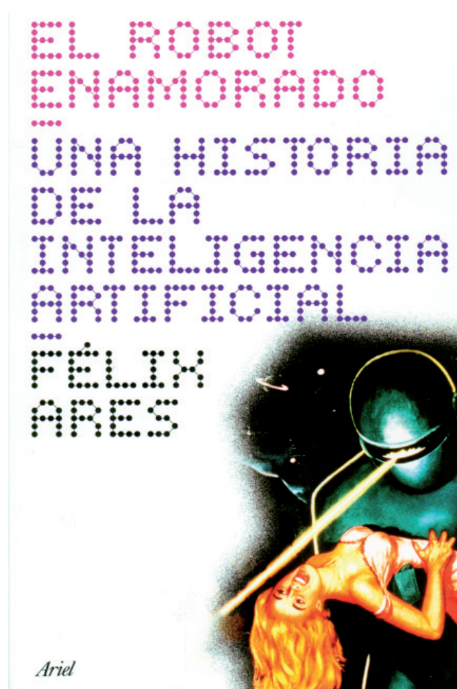
Portada original (Editorial Ariel)

A medio discurso observé abundantes gestos de disgusto.