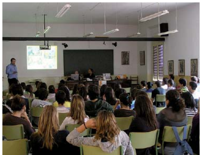
Charla escéptica en el instituto Ramón Muntaner de Figueras. [Archivo]

Durante la misma se mostraron vídeos y repartieron ejemplares de «El EscolARP», trípticos de ARP-SAPC, ejemplares de «El escéptico» y propaganda de la colección, además de la donación a la biblioteca del centro de un libro de la colección '¡Vaya Timo!'.