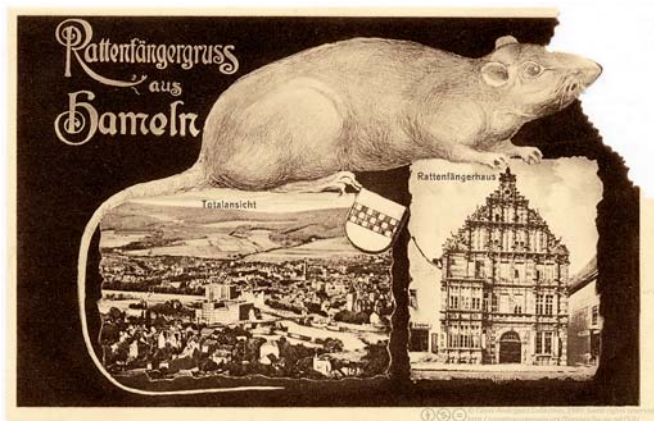
Tarjeta turística de la localidad alemana de Hamelin fechada en 1930. El pueblo solo era famoso por el cuento del flautista, por lo que se anunciaban con la figura de una rata (Casas-Rodríguez)

Sus aportaciones se centraron obsesivamente en la definición de turista, una operación que dio mucho contenido y durante muchos años a sus esfuerzos por conocer adecuadamente la nueva materia de estudio y que llenó casi todas las décadas del nuevo siglo. Téngase en cuenta que para entonces se empeñaron en distinguir tan exactamente como fuera posible a los enaltecidos turistas de los vulgares viajeros ya que la demanda de la que dependía el éxito de lo que llamaron la industria del turismo no era otra que la que hacían los turistas, no los viajeros. Es decir, que con la búsqueda de una definición exacta y universalmente admitida de turista se pretendía poner las bases para poder conocer y cuantificar la demanda de turismo. El turista se convirtió así en una especie de Rey Midas ya que todo lo que tocaba o le interesaba se convertía en objeto de estudio para los turisperitos y, por ende, en turismo. Como digo, para los investigadores un turista no era un viajero cualquiera sino un viajero que debía tener ciertas peculiaridades las cuales había que saber identificar correctamente si se quería avanzar en el nuevo corpus teórico que se venía perfilando, la que algunos dieron en llamar, repito, economía del turismo.