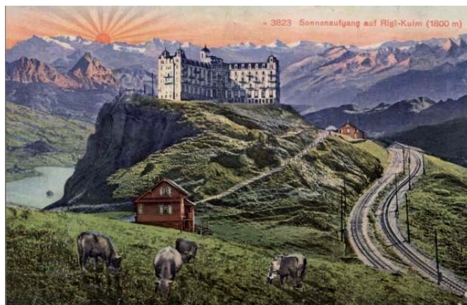
Postal del hotel alpino Rigi-Kulm de 1872. (Georg Ragaz)

ofrecer servicios de hospitalidad a los pasajeros. Un ejemplo lo encontramos en la ciudad de Brighton, en el sureste de Inglaterra, famosa por tener una de las playas más concurridas de Europa desde hace más de un siglo. Y no digamos nada de las ciudades del Mediterráneo, dotadas muchas de ellas de monumentos históricos de relieve, como Nápoles o Venecia, o de ruinas del pasado como Pompeya, Atenas o Roma.