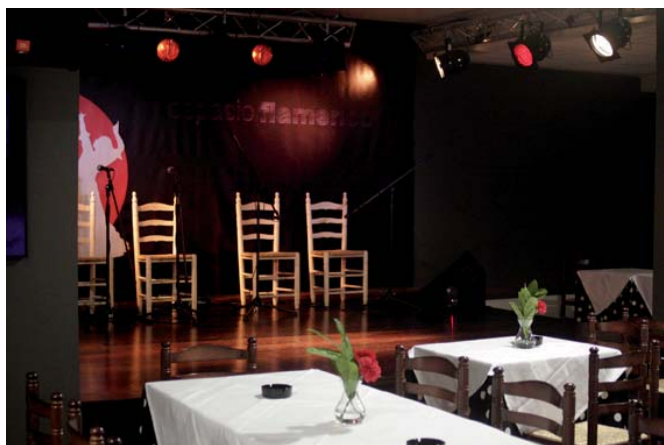
Tablao flamenco en Madrid, lugar de peregrinación turística artificial. [Archivo].

es. Tinard acertó de pleno y de plano. Y basta con echar un vistazo a lo que hacen muchos hoteles y muchas empresas aéreas: prestan servicios de alojamiento o de transporte pero también ofrecen a sus clientes no lo que desde la irrupción del marketing se viene llamando «paquete turístico», es decir, un binomio formado por dos productos «turísticos», el servicio de hospitalidad y el servicio de transporte, dos servicios a los que se insiste en considerar turísticos por antonomasia, sin serlo. Pues bien, desde hace poco las citadas empresas están empezando a producir y vender no estos paquetes sino programas de visita, es decir, verdaderos productos turísticos. Demuestran así que entre las hoy mal llamadas empresas turísticas hay algunas que están consiguiendo madurar y convertirse en fabricantes de turismo.