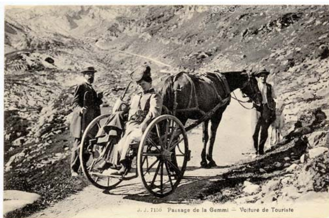
Carro para turistas en los Alpes Suizos, primer destino turístico moderno. Fotografía de 1904. [Jullien Frères]

Porque el turismo, tanto el corpus teórico como lo que se llama industria turística, recuerda a las cebollas en que es esférico y está formado por numerosas capas, muchas de ellas invisibles, bien porque aun no han sido evidenciadas por los turisperitos o bien porque los turisperitos prefieren