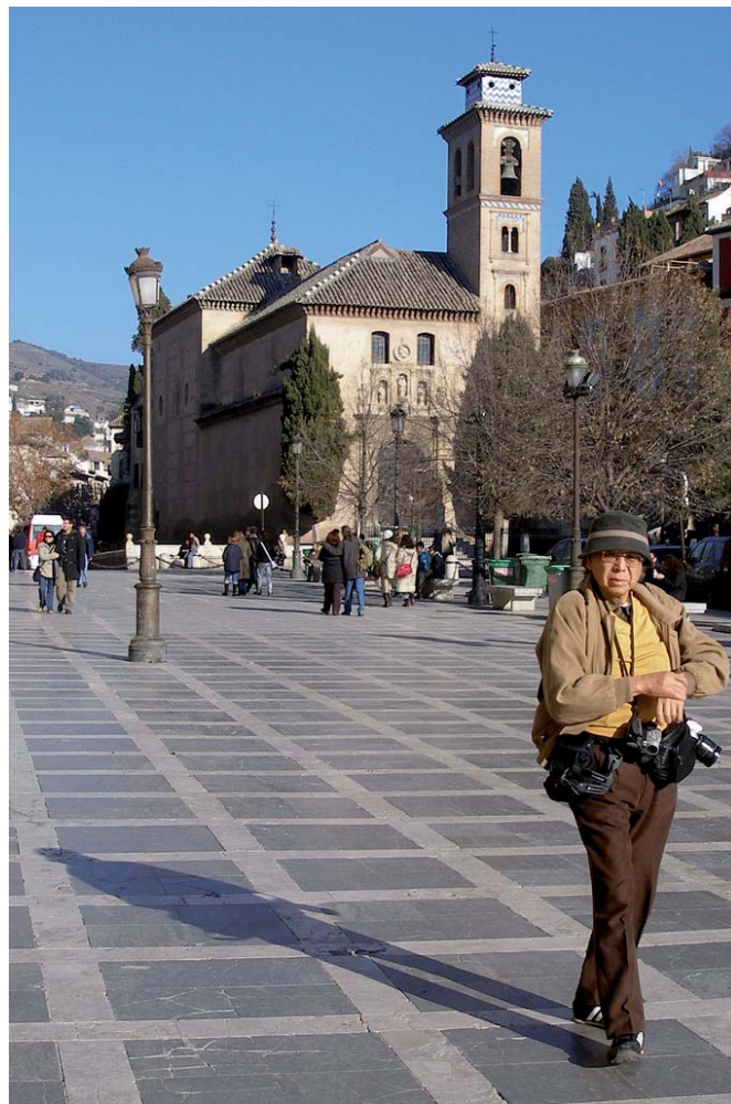
Todavía turista es sinónimo de extranjero. En la imagen, turista japonés en Granada.

La nueva hoja quitada a la cebolla mostró que lo que define a un turista no es que sea extranjero sino solo y exclusivamente estar en un lugar pasajeramente por no ser residente habitual en el mismo. Hasta no hace mucho no se admitía aún la existencia de lo que algunos llaman hoy turismo interior, el que no implica cruce de fronteras exteriores. Hoy sí. Pero, una vez más, el empecinamiento en la condición de extranjería no se habría producido si se hubiera hablado de forasteros en un lugar concreto, no de extranjeros, ya que este calificativo hace referencia a un estado soberano. La historia de la desfoliación de la cebolla turística está plagada de absurdos empecinamientos de este tipo provocados por unos compulsivos, evidentes e inadecuados planteamientos del problema. Mejor dicho: provocados por un inadecuado planteamiento del problema. Como se sabe, problema bien planteado problema resuelto. Pero el turismo se ha planteado siempre resaltando las apariencias externas, es decir, su condición de fenómeno, y por esta razón su