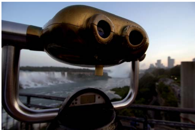
Las Cataratas del Niágara. El turismo ha convertido esta belleza natural en un empalagoso destino turístico. [Archivo].

turísticos, en función de la mayor o menor frecuencia con que son demandados por los turistas, una característica que puede variar y de hecho varía de un lugar a otro con la consiguiente imposibilidad de contar con datos estadísticos territorialmente agregados, una operación que sin embargo se lleva a cabo sin pestañear por parte de los organismos internacionales que publican estadísticas sobre el turismo. Obviamente, tal clasificación nunca podrá ser universal ya que solo puede tener sentido en el marco de cada lugar. En cualquier caso obligaría a hacer la misma clasificación con los mismos lugares especializados en recibir flujos masivos de visitantes, los conocidos como destinos turísticos, una denominación que se toma de los estudios de transporte en la medida en que, a menudo, se confunde el turismo con esta actividad por el mero hecho de que la industria del transporte sea auxiliar del turismo.