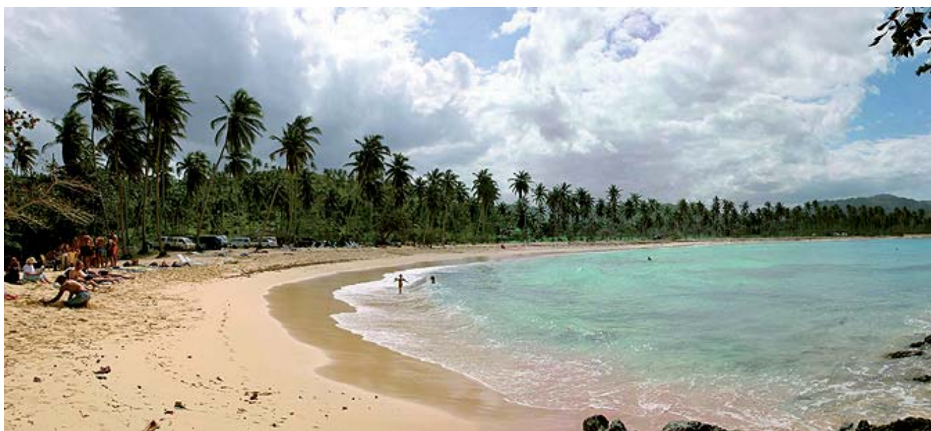
Playa paradisiaca llena de turistas.

del turismo son hoy por hoy engañosas porque unas veces excluyen actividades que son objetivamente turísticas y otras incluyen las que no lo son. Todo ello lleva a caer en la doble o triple contabilidad, justo el peligro que siempre debe evitar cualquier registro estadístico que aspire a ser creíble. También se acabará de una vez por todas con la insoportable superchería de afirmar una y mil veces que la industria del turismo es la primera industria no de España sino del mundo, como sostiene la OMT haciendo gala del uso propagandístico que viene haciendo desde 1946 de lo que es una aproximación pseudo-científica al conocimiento del turismo. Y por parte de los turisperitos se acabaría para siempre que hablen y no paren de la consustancial complejidad del turismo. Pues no hay complejidad, las nefastas consecuencias de un mal planteamiento sostenido y blindado con la ayuda de la Aiest y de la OMT.