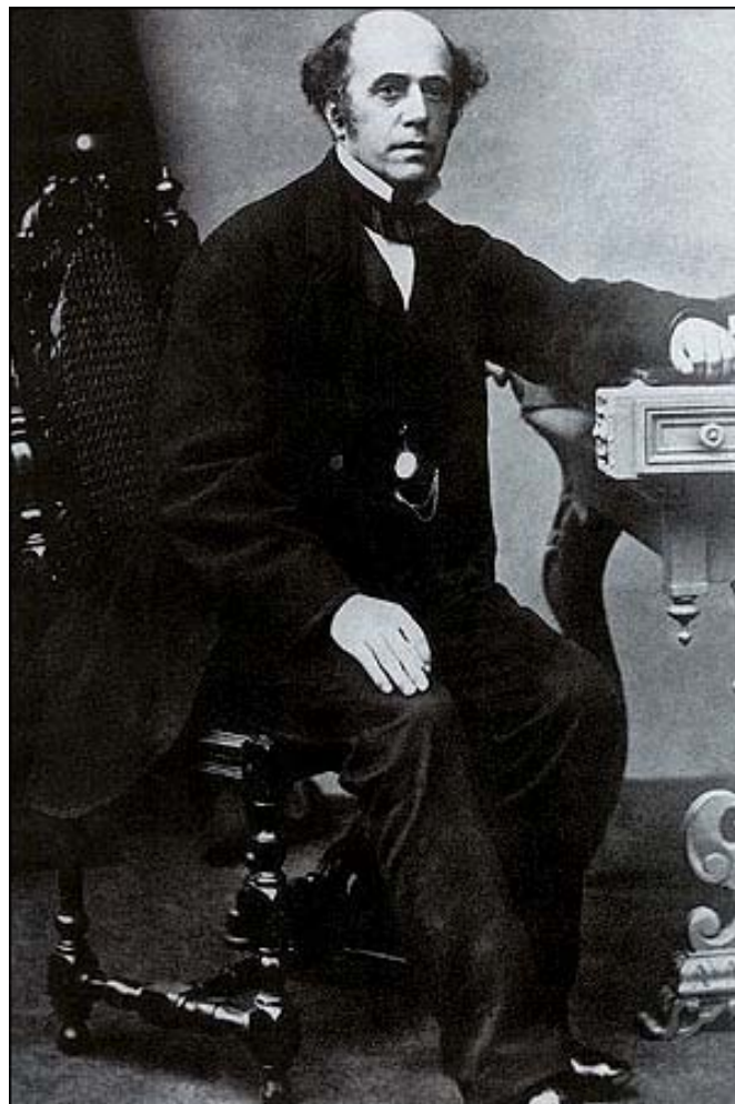
Sir Thomas Cook. Considerado el primer agente de viajes organizados. Empezó en 1851 dando soporte a congresos profesionales y exposiciones universales.

Identificado el turismo como una actividad productiva queda ahora por identificar a la empresa turística. Antes había que partir de la existencia de un consenso no formulado para «saber» cuáles son las empresas turísticas. Ahora basta con decir que una empresa turística es aquella que produce programas de visita o de estancia pasajera. Si con esta identificación volvemos al pasado nos sorprenderá saber que la primera empresa turística surgió en Inglaterra en la década de los cuarenta del siglo XIX. Me refiero a la empresa que fundó Thomas Cook, dedicada a la elaboración de programas de visita. Con motivo de la exposición Universal de Londres de 1851, la empresa de Cook experimentó un fuerte crecimiento y se expandió por Europa y Estados Unidos. Resulta sorprendente que este tipo de empresas, las únicas que deberían ser tenidas como turísticas, pasaran inadvertidas a los primeros desfoliadores de la cebolla turística, los cuales, como ya hemos visto, se centraron obsesivamente en las empresas de alojamiento, los hoteles y similares. Las empresas como la que fundó Cook se denominaron agencias de viajes y también turoperadoras, es decir, operadoras