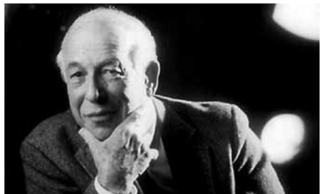
Philip J. Klass