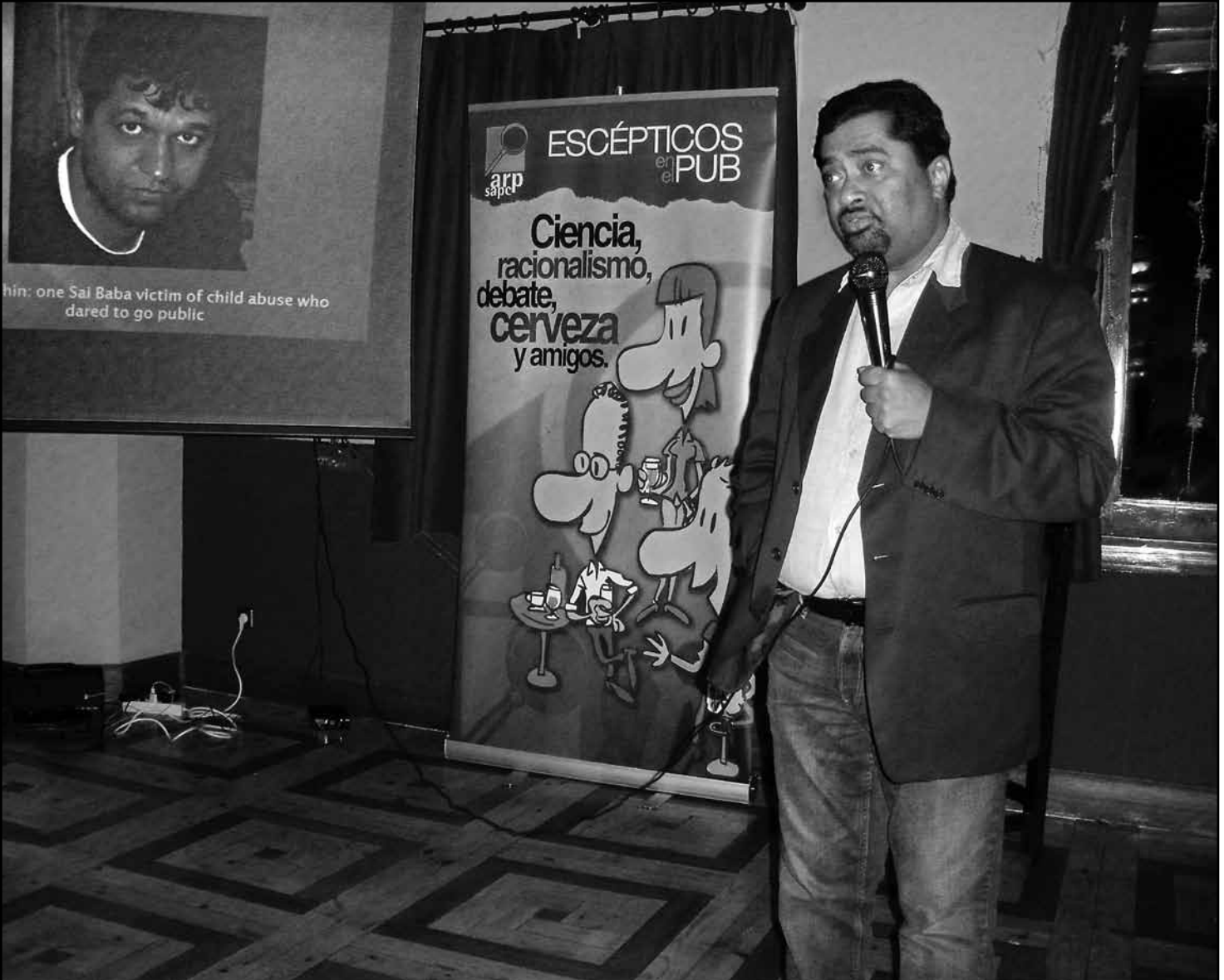
Una intervención en "Escépticos en el Pub" Madrid.

notase. Le recomendaron impedir que el 'mago' le tocara, porque hay sustancias que pueden atravesar la piel, y que no consumiese nada durante el espectáculo. Aunque no se hubiese muerto, asegura, con haberse desmayado por televisión, independientemente del motivo, habría sido un