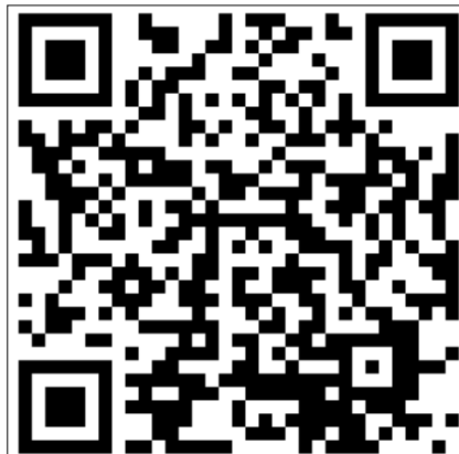
Jesus water dropping miracle in Mumbai-Sanal Edamaruku explains