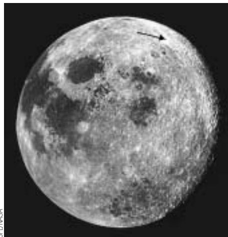
Ubicación en la Luna del cráter dedicado a Giordano Bruno

Si un asteroide pequeño chocara contra la Luna, ¿seríamos capaces de ver el impacto a simple vista? En sus crónicas de la vida medieval, Gervasio de Canterbury describió un impactante acontecimiento presenciado en la tarde del 18 de junio del año 1178: “había casi una brillante Luna Nueva... y el cuerno superior se partió repentinamente en dos. Del punto medio de esta división se