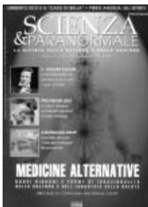
Scienza & Paranormale n° 41, enero-febrero 2002.

Uno de los novedosos aspectos aportados por esta revista es el medio que tienen para financiar su nueva sede, que es mediante donativos de particulares. Queda publicado el nombre de los contribuyentes, la cantidad aportada, y una relación de las instalaciones y ob-